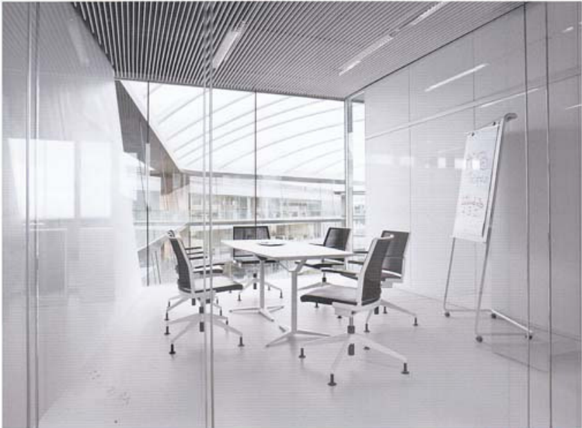
View of the meeting room