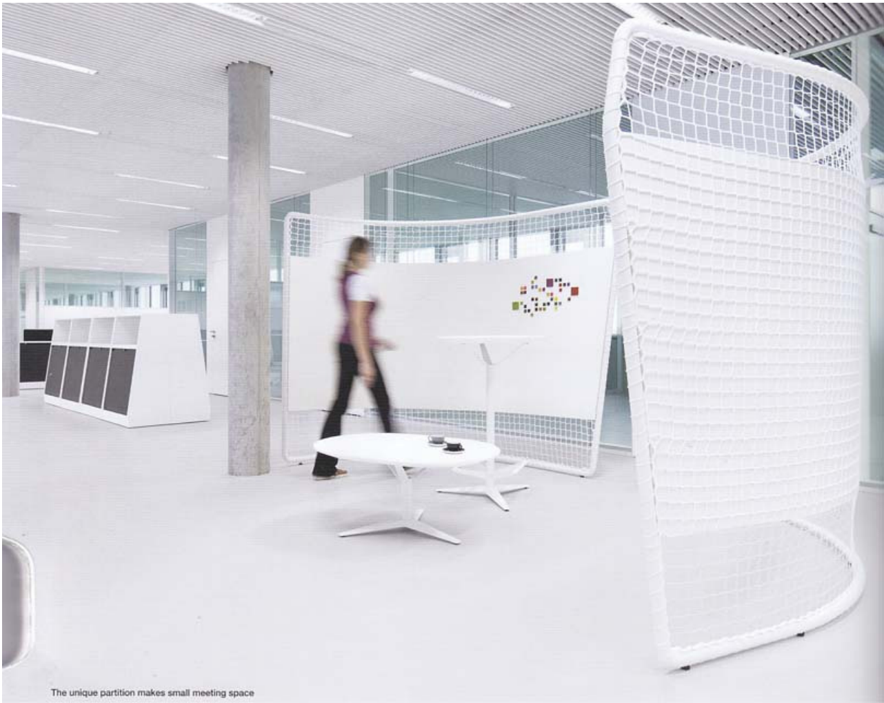
The unique partition makes small meeting space