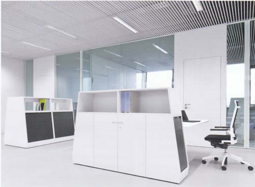
The modular furniture system 'teamplayer'