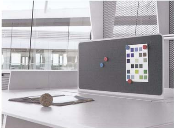
Detail view of furniture