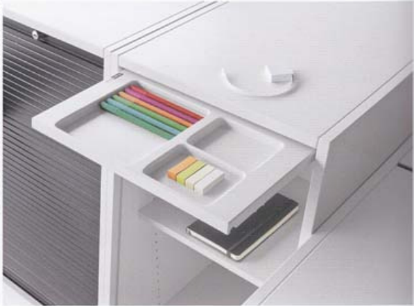
Detail view of furniture