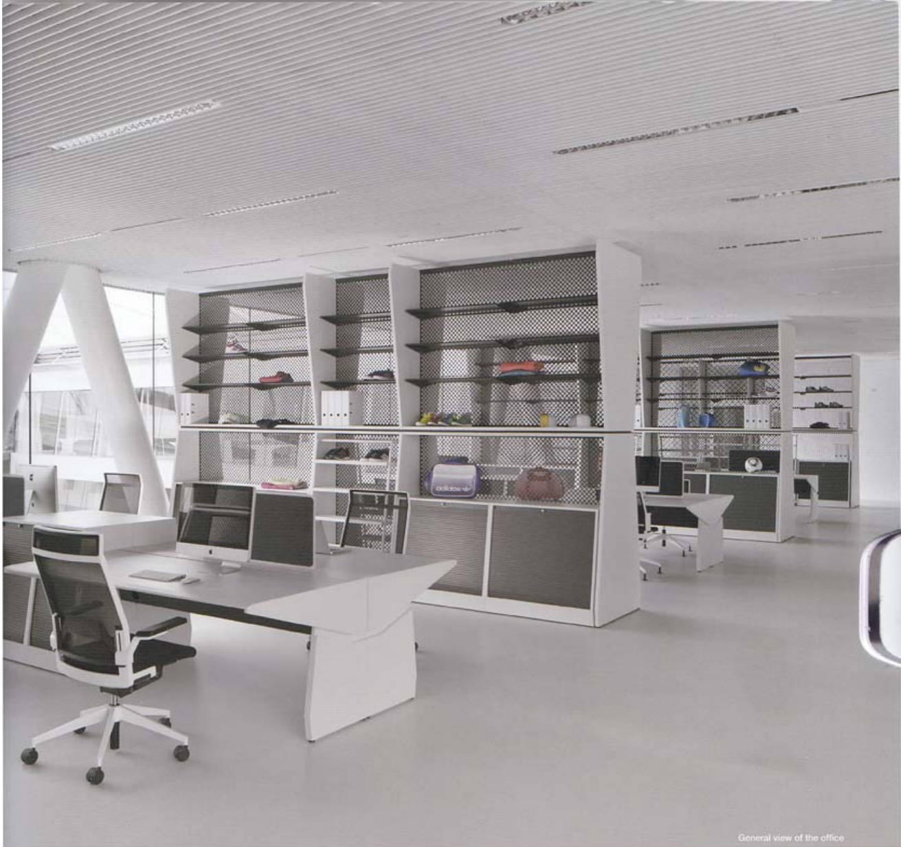
General view of the office