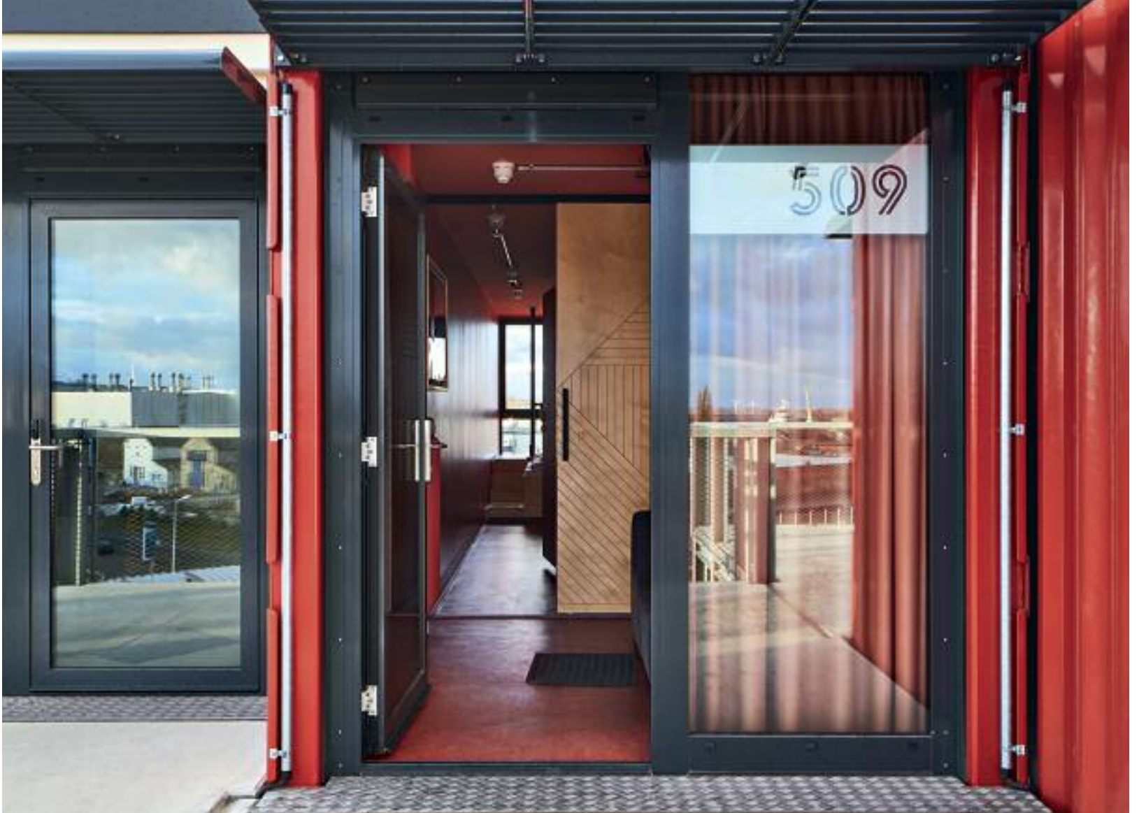
Über Laubgänge, die den Containern vorgelagert sind, werden diese großzügig erschlossen. • The containers are accessed via generous pergolas located in front of them.