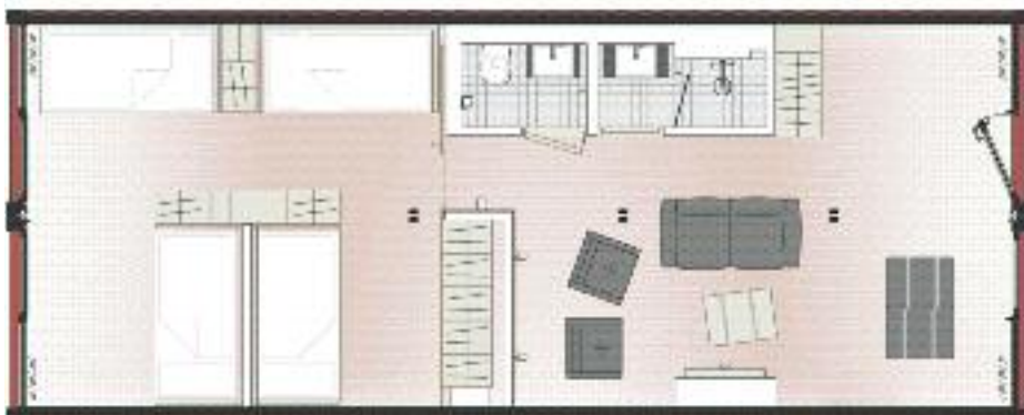
Grundriss Achter-Container • Floor plan container for eight